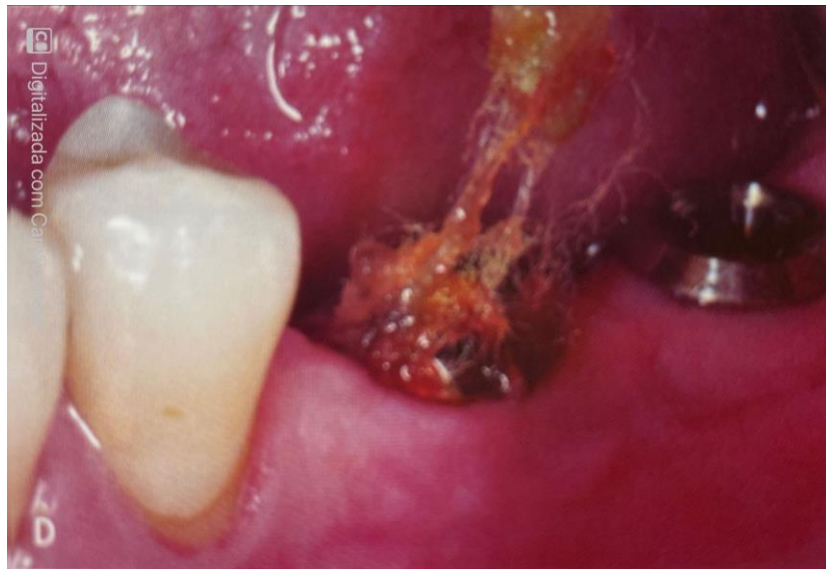
Figura 3. Peri-implantite causada por acúmulo de fio dental.