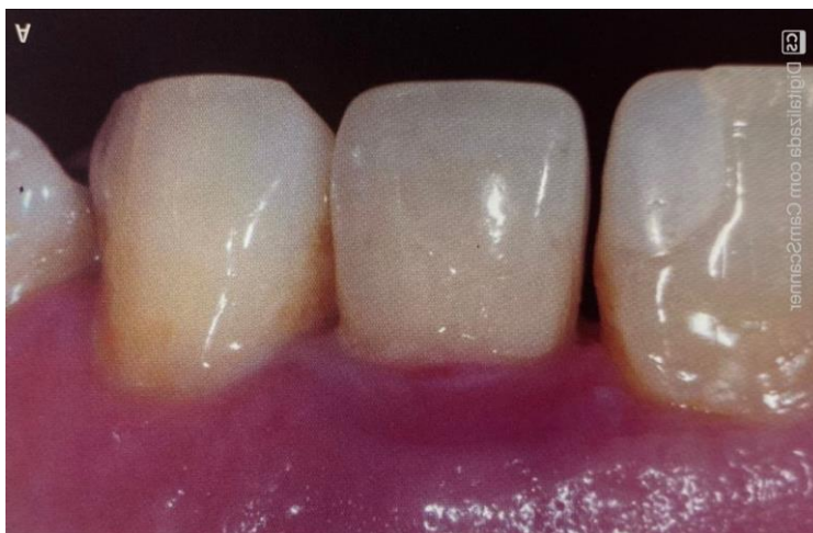
Figura 1. Peri-implantite causada por excesso de cimento.

Logo, há uma preferência em usar coroas aparafusadas Devido à dificuldade de remover o excesso do cimento de coroas com margens mais profundas (Margarida et al., 2018). Segundo estudo que tinha como objetivo avaliar essa relação de excesso de cimento e o desenvolvimento de periimplantite, 81% dos implantes instalado que apresentavam excesso de cimento residual subgengival, deram sinais clínicos de patologia periimplantar num período de 4 meses. Realizaram a remoção do cimento do sulco periimplantar usando a microscopia ótica, confirmou à regressão do quadro inflamatório num período de um mês em 74% dos implantes (Wilson Jr et al., 2009).