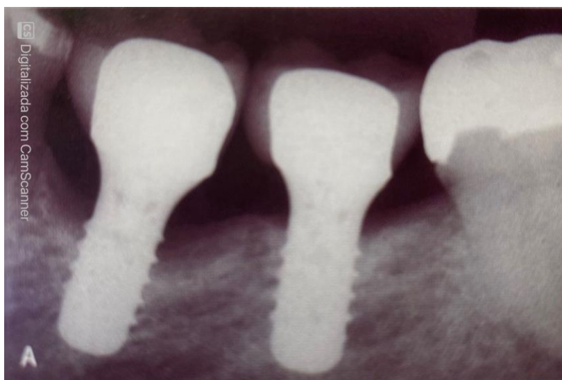
Figura 1. Vista radiográfica da Peri-implantite (perda óssea marginal ao redor do implante).

Pode-se fazer uso também do antibiótico, como sendo um auxiliador para o tratamento das doenças peri-implantares. Porém, deve-se atentar para não causar uma resistência bacteriana (Pessoa et al., 2013).