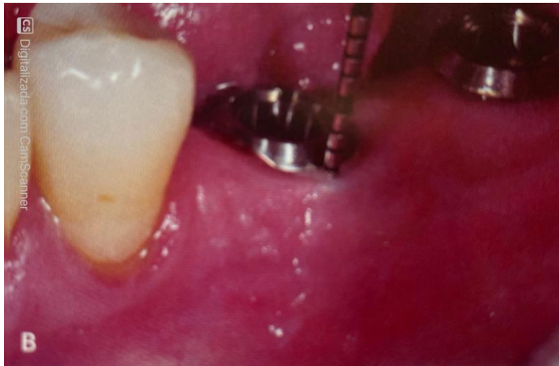
Figura 2. Profundidade a sondagem com 6mm.

KAHN, Sérgio. FISCHER, Ricardo. DIAS, Alexandra. Periodontia e implantodontia contemporânea. 1º edição. São Paulo: Quintessence editora, 2019.