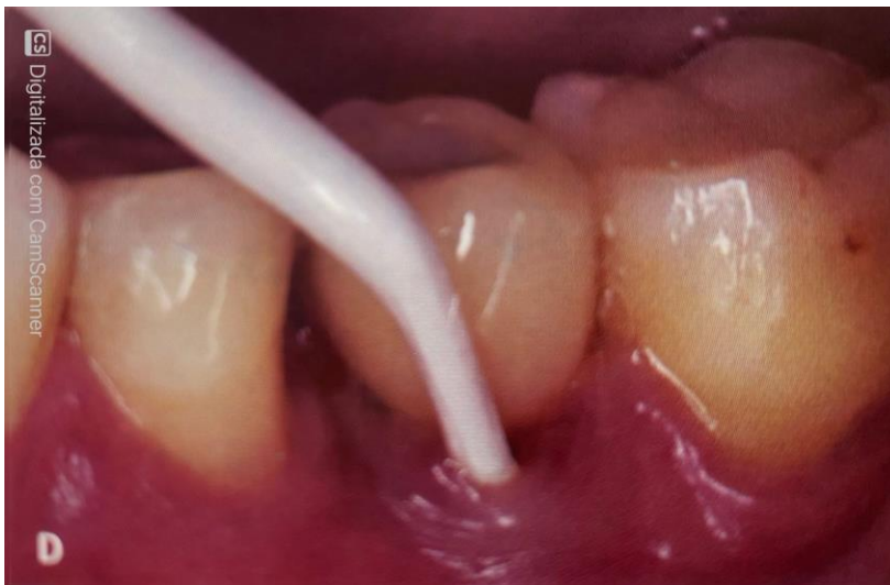
Figura 2. Debridamento mecânico com cureta plástica.