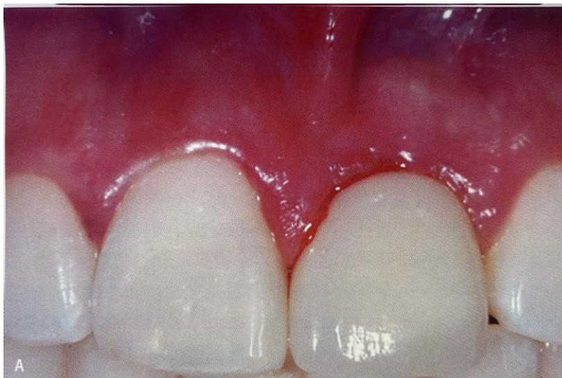
Figura 3. Aparência clínica da Mucosite peri-implantar.

KAHN, Sérgio. FISCHER, Ricardo. DIAS, Alexandra. Periodontia e implantodontia contemporânea. 1º edição. São Paulo: Quintessence editora, 2019.