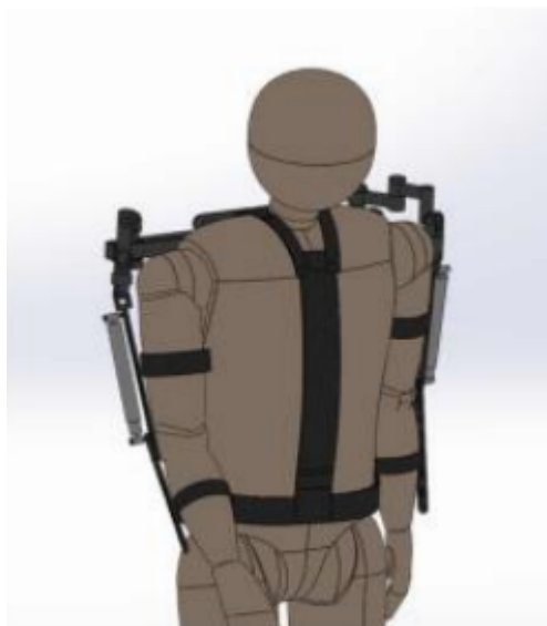
Figura 1: Projeto de exoesqueleto para membros superiores desenvolvido por pesquisadores da UPF.

Em consulta aos resultados apresentados por Kaiser e Bing (2020) e no site do Projeto de Pesquisa da UBS, percebe-se que ainda não houve a prototipagem de tal instrumento, mas estudos traçam um perfil de exoesqueleto que atenda aos objetivos da pesquisa. Há informações no site do projeto que prevê o desenvolvimento e simulação tanto para reabilitação do ser humano quanto da análise do movimento - no sentido de previsão e redução do esforço. O projeto pode ser observado na Figura 1.