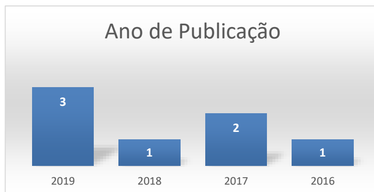
Gráfico 2: Artigos por ano de publicação.

Os artigos selecionados foram encontrados nos anos de 2019, 2018, 2017 e 2016, conforme mostra o gráfico abaixo: