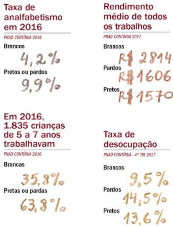
Figura 3: Desigualdade entre negros e brancos