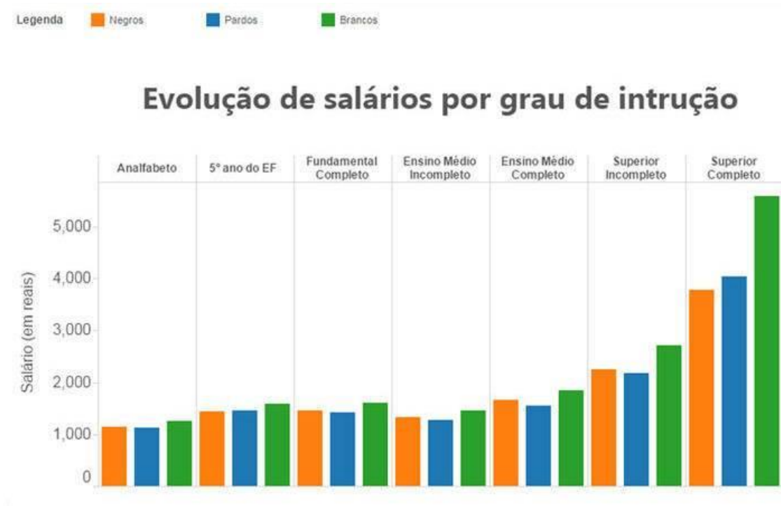
Figura 1: Figura sobre a evolução de salários por grau de instrução entre negros e brancos – Fonte/ Revista Exame