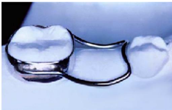
Figura 1- Mantenedor de Espaço Banda Alça

- Banda-alça: Sua indicação é relacionada à perda precoce não muito extensa, em casos em que acontece a perda de um único dente, unilateral. É uma solução indicada para os arcos edêntulos anteriores pediátricos. Com adaptação de uma banda ortodôntica, geralmente no primeiro molar permanente ou no segundo molar decíduo, com o auxílio de um fio de aço inoxidável de 0,9 mm ou 1 mm soldada aos molares que sustentará o aparelho e adaptada no espaço da perda (KHARE et al. , 2013; ABRÃO et al. , 2014) (Figura 1).