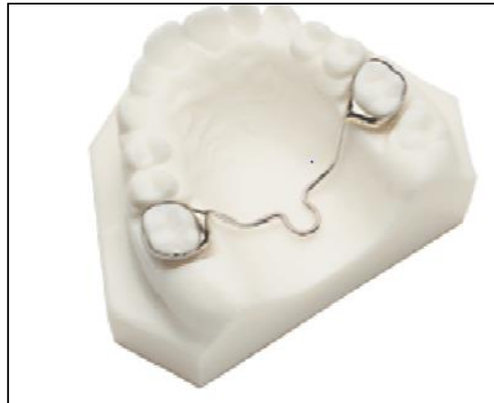
Figura 6- Mantenedor de Espaço Barra Palatina

Palatina também pode ser soldada nas bandas dos molares ou encaixada no tubo lingual na face palatina das bandas permitindo a remoção e ativação com maior facilidade (GREEN, 2015) (Figura 6).