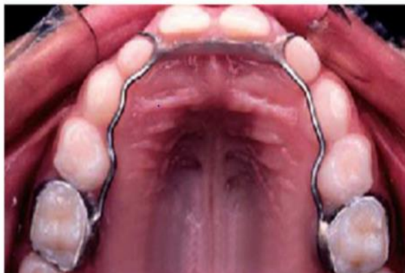
Figura 3- Arcada dentária com Mantenedor de Espaço (vista palatina).

- Estético Funcional Fixo: Indicado quando há perda de um dente decíduo antes do período correto em condições normais, ocorrendo a má oclusão (Figura 3)