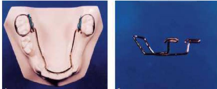
Figura 4- Mantenedor de Espaço Lingual de Nance