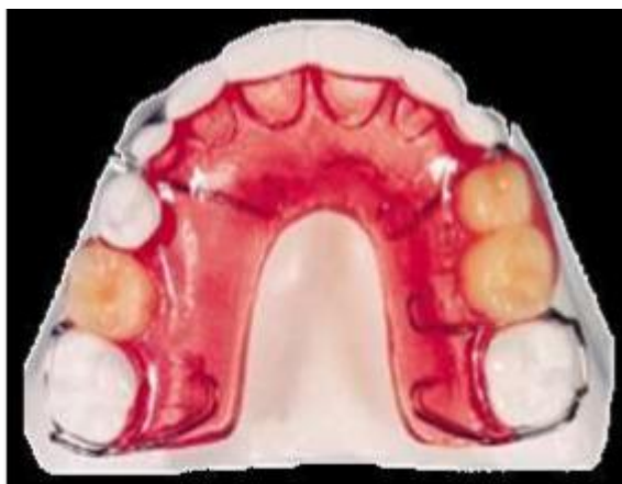
Figura 7- Placa de Hawley modificada

- Placa de Hawley modificada: Utilizados em perdas múltiplas, é considerado um aparelho mantenedor de espaço funcional, possuindo dentes em resina acrílica ou pré-fabricados, tem como vantagem não ser só funcional como, recuperar estética do paciente (Figura 7). Realiza a adaptação de uma placa em acrílico com os elementos que irão preencher o espaço edêntulo que irá manter o espaço (BORGES et al. , 2011).